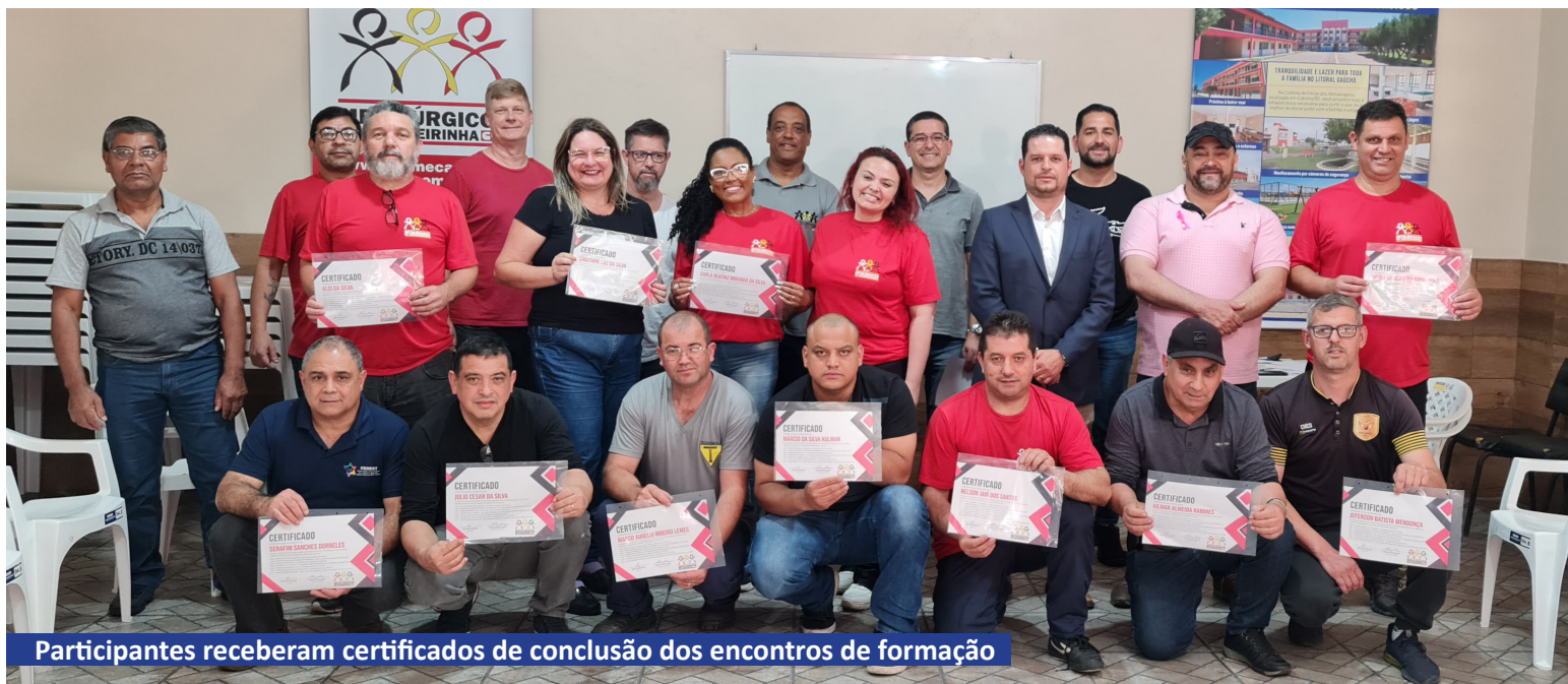
Participantes receberam certificados de conclusão dos encontros de formação

No dia 26 de outubro, os diretores e diretoras do Sindicato participaram do último encontro de formação programado para o ano. Ao todo, foram 7 encontros que abordaram pautas de grande importância para os trabalhadores, como política sindical e conjuntura, acidente de trabalho e reforma da previdência, legislação trabalhista, história de luta sindical, comunicação sindical física, comunicação sindical nas redes sociais e direitos da mulher.